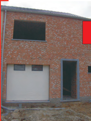
De garagepoort werd geplaatst