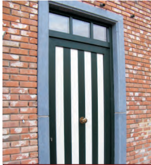
Plaatsen van voordeur