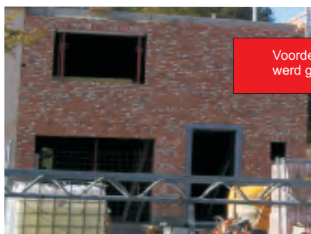
Voordeuromlijsting in blauwe steen werd geplaatst.