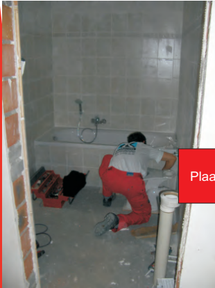
Plaatsen van sanitaire toestellen