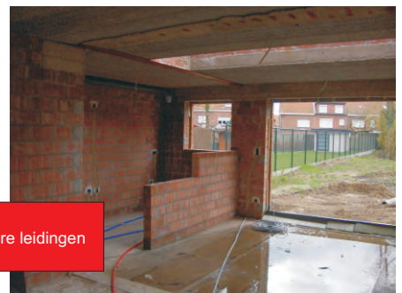
Plaatsen van elektrische en sanitaire leidingen