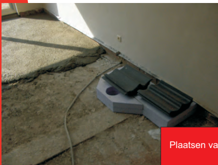
Plaatsen van uitsparing voor speksteenkachel