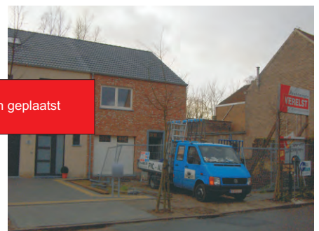
Ramen en deuren worden geplaatst