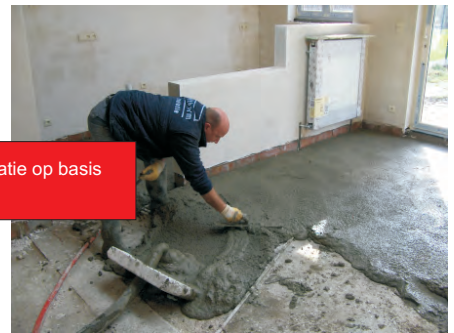
Plaatsen van vloerisolatie op basis van isomobolletjes