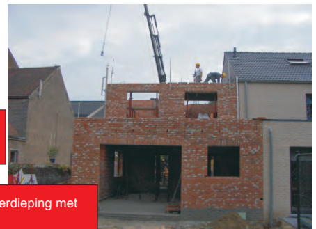
Welfsel geplaatst boven verdieping met kraan.