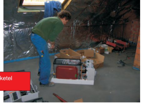
Plaatsen van verwarmingsketel op zolder