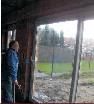
Plaatsen van het glas in schuifraam