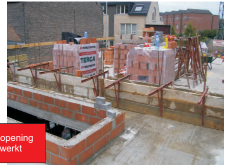
De betonbalk werd gegoten en de opening van de lichtkoepel wordt verder bewerkt.