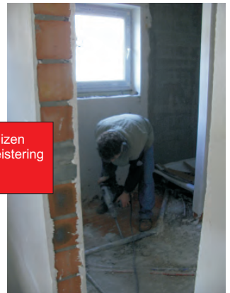
Plaatsen van verwarmingsbuizen in badkamer en cementbepleistering van de douche