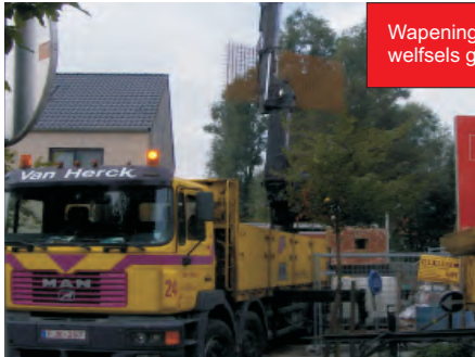
Wapening voor betondruklaag wordt op de welfsels geplaatst door kraanman.