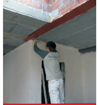
Uitvoeren van pleisterwerken