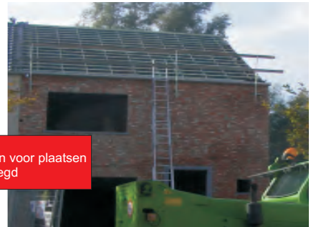
Daktimmerwerken: panlatten voor plaatsen van dakpannen worden gelegd