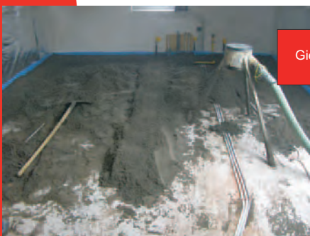
Gieten van chape