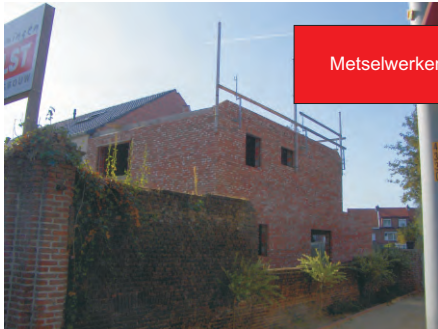
Metselwerken tipgevels voor dak