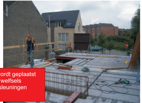
Wapeningskorf voor betonbalk wordt geplaatst. Randbekisting voor druklaag op welfsels wordt geplaatst en de veiligheidsleuningen worden in orde gebracht.