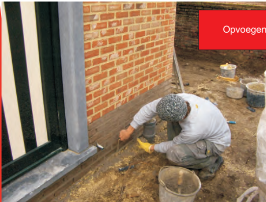
Opvoegen van het huis