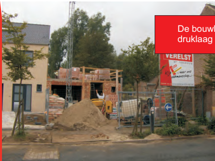
De bouwlift wordt geplaatst nadat de druklaag werd gegoten.