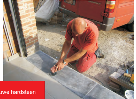
Opschuren blauwe hardsteen