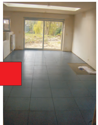
Plaatsen van de vloer