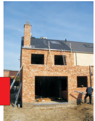
Schouw werd gemetst, ronde zinken afvoerbuizen en zinken hanggoot worden geplaatst